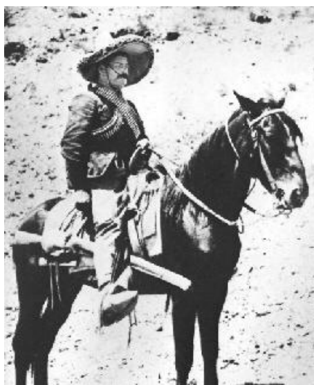
FIG. 1: Pancho Villa sur son fameux "Siete Leguas"

Au 19 ème siècle, la majorité de la population paysanne du Mexique travaille dans de grandes haciendas sous le contrôle des colons. Leur conditions de vie difficiles engendrent la montée d'un mouvement de révolte, canalisé par les leaders Pancho Villa et Emiliano Zapata (figure 1), qui conduit le pays à la révolution le 20 novembre 1910. Cette dernière, longue et mouvementée, plonge le pays dans une guerre civile. Toutefois, en 1917, Carranza impose une constitution socialisante et centralisatrice qui donne ses premières bases politiques solides au Mexique post-révolutionnaire des années 20 ( Encyclopedia Universalis ).